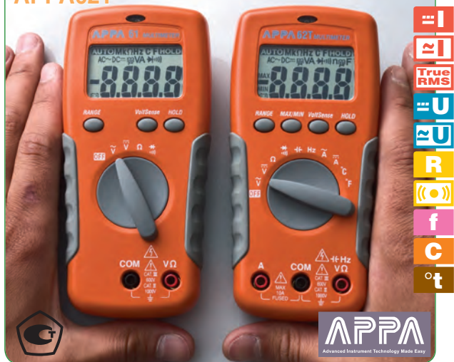
* Модели с индексом "R"